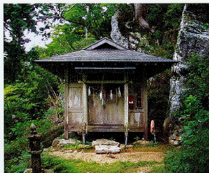
工石神社 (北・南頂上分岐奥)