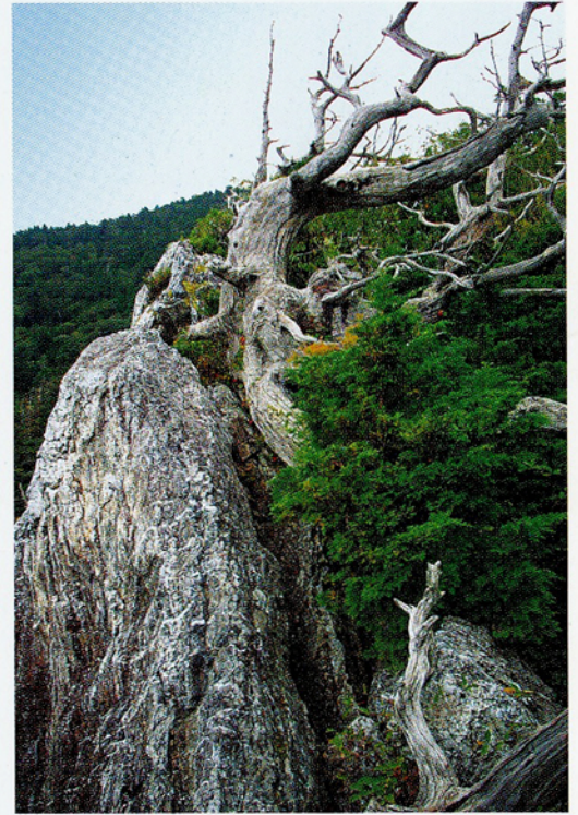
② ヒノキびょうぶ岩