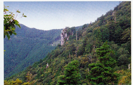
ヒノキびょうぶ岩から見た妙体岩