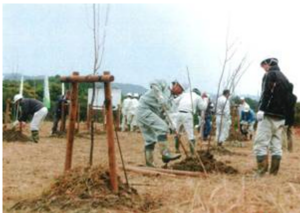
センダイヤザクラを植樹

いの町汗見公園づくりとして、草刈り及び地拵えとヒノキの間伐、周辺の雑木等の除去により、景観を整え、センダイヤザクラ等の苗木 20本を、県中央西林業事務所職員も協力して、36名で植栽した。また、植樹前に、植樹場所の上方にある40年生のヒノキ林 0.3haを間伐し、あわせて草刈や雑木の除去など地拵えを実施した。