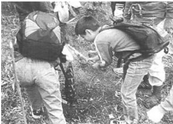
4月の「たけのこ掘りた〜い」でタケノコ掘りの様子