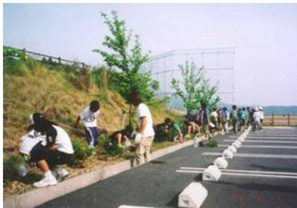
穴を掘って1本ずつ丁寧に植えた

土佐清水ライオンズクラブでは、自然の中で活動することで自然に親しみ、心身ともに健全なこどもの育成を図ることを目的として、「小学生の為のセミナー」を実施しており、今年度は1泊2日の日程で開催。その1日目に、緑の募金の支援を受けて植樹活動を行った。ヒラドツツジを250本、セミナーの参加児童が体験した。市内小学校に募集パンフを配布し、会員を合わせて総勢61名の参加者が、スコップを手に協力して植えた。