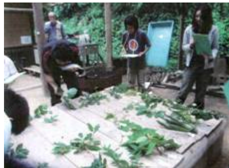
上写真／樹木博士認定試験中 下写真／ペレット工場の見学。 実際にペレットに触 りながら話を聞く。

ほぼ月に 1度「森林環境・生態」と「木の有効利用」に関する講座を実施した。里山観察、樹木観察と樹木博士認定試験の実施、事前に子どもたち自身がキャンプの内容を考えた「夏のキャンプ」を仁淀川町で実施、水生昆虫の観察・採集や魚釣り、神社の森と巨木観察、昆虫採集など動植物についての学習をした。また、梶原町では伐採地や製材所、ペレット工場を見学し、森林組合職員さんから講義を受け、林業について学習した。こうした講座で学びながら、子ども森林インストラクターを養成した。