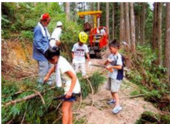
上ノ間伐材の搬出

森での体験として、森林浴、木登り、ツリーハウス、ブランコなど森での遊びや、溪流遊びなど各種自然体験をしながら、交流をはかるとともに、「もったいない」の心の養成を行った。