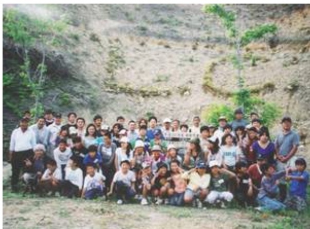
参加者全員で植樹したツツジの前で記念撮影