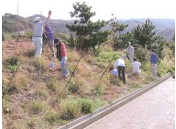
協力して苗木を植えた

奈半利町ふるさと海岸へ、ヤブツバキ100本と河津桜4本の植樹を行い、支柱を立てて植樹帯が完成した。