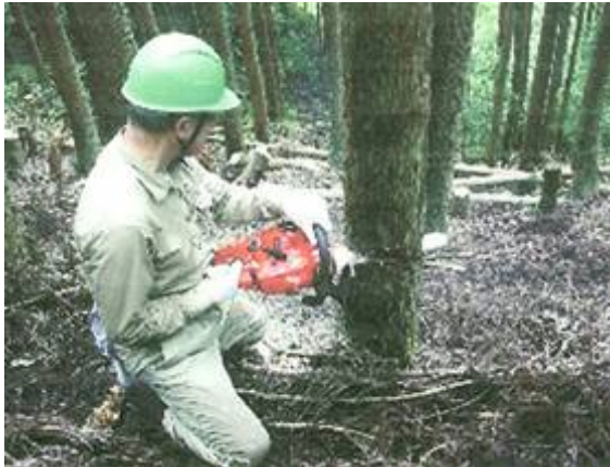
上／間伐作業のようす

4月から11月までの毎月 1回、2日間程度、会員による作業を実施しました。作業内容としては、対象森林の本数・材積の把握、選木などの現況調査、チェーンソー及びノコギリによる間伐木の伐倒及び枝払い・玉切り作業、間伐材を利用した施設等の整備を行った。延べ 102名が参加し、1.1haの間伐を行うことができた。