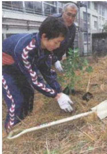
左：生徒による植樹 ヤマザクラ、クロガネモチ、オナツツジ、ミツバツツジ、ヤブツバキ、ヒメシャラ、イロハモミジなどを植樹しました

記念植樹は、学校行事等の都合で1月の実施となったが、最終年ということもあり 終了式典として、今まで関わってくれた方々を招待し、65名が参加した中、生徒により110本の苗木が植えられた。