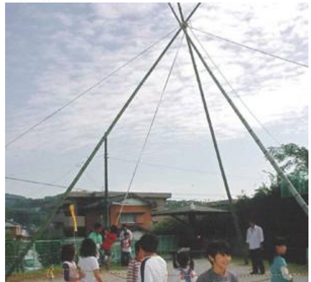
竹ブランコでは子どもたちの順番待ちの列が・・・