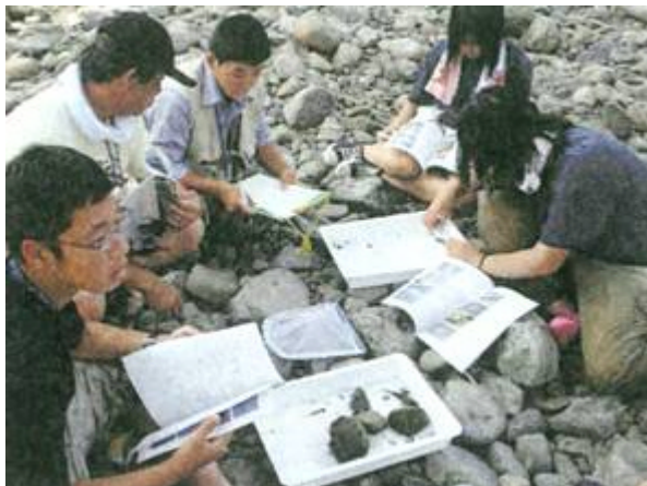
上写真：作業の大変さを実感。下写真：川では水生生物の観察スコアから水質について知ることができた。