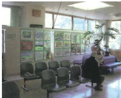
上/蔓を使った器づくりを教わる生徒達 下/森林や自然に注目した絵画の展示の よこす (病院のロビー)