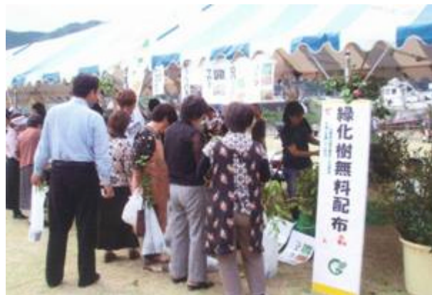
上：苗木の無料配布 下：木工教室

須崎地区森林組合、幡東森林組合では、ヒメシヤラ、コナラ、イロハモミジ、ケヤキ、ヤブツバキなどの苗木の無料配布を行い緑化の推進に貢献した。窪川町森林組合、四万十中央森林組合では、木工教室を開催し、本箱・ミニ机や自由な木工クラフト作りを行なった。親子のふれあいとともに多くの方が木に親しんだ。大正町森林組合では、苗木の無料配布および木工教室を開催するなど、各地でそれぞれ特色のある取り組みを開催した。