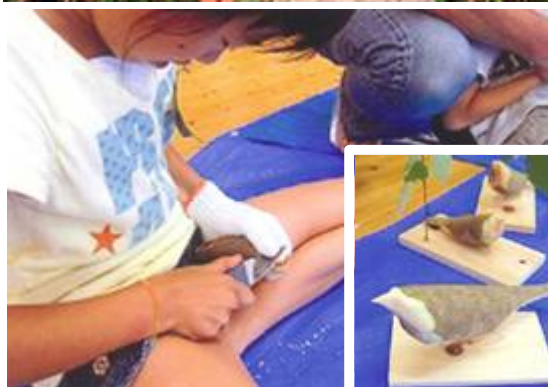
下ノバードカービングに挑戦