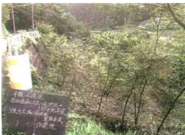
作業実施後、下草が刈られ、すっきりとした河畔林