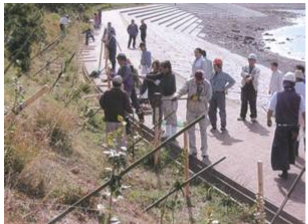
支柱をしっかり打ち込み、海岸植樹帯が完成した