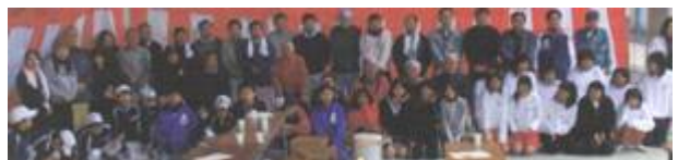
下：1月18日の終了式典。今まで関わってくれた方々との記念撮影