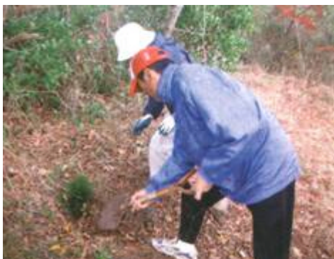
上写真/集落南側の松林での植樹 活動 下写真/1本ずつ丁寧に植えてい く住民のみなさん