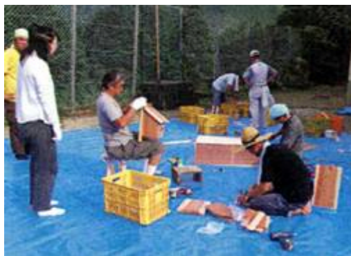
上ノ巣箱とイスづくり 下ノ木の特徴を見極めてヤスリでひたすら磨いていく木のスプーン

9月20日、間伐材等を使って本箱・椅子・巣箱づくり、野鳥やヤマネの話も聞きながらの作業。そして、山から伐り出してきた竹を使って器と炊飯器作りを行った。山と川の話、イノシシを中心とした野生動物の話などをしながら交流した。9月21日、仁淀川に流れ込む小川「梅の木川」の清掃活動の後、越知町の子どもたちと様々な種類の木を使ったスプーンづくりを行い、木の特徴や材としての使い方を学んだ。子ども24名と大人17名が参加し、地域との交流も深めることができた。