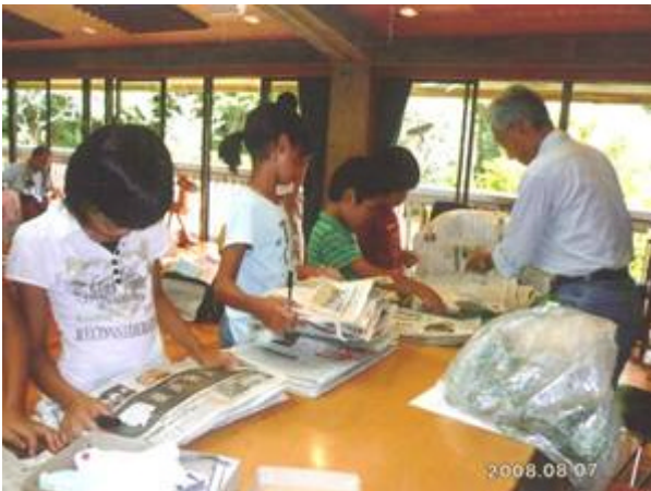
採取した草木の名前と標本(押し葉)の作り方の学習

また、木炭と七輪を使って陶芸体験を実施し、木が生活の中で活かされていることを学んだ。