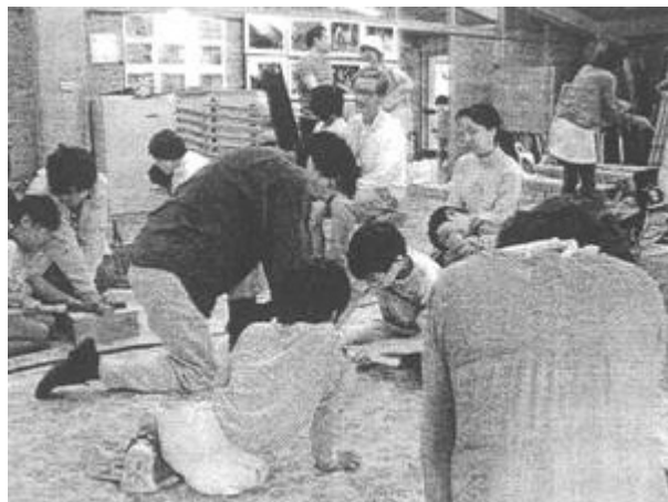
親子で協力して作りました（1回目のどんぐりとかぶと虫）

「どんぐりで遊ぶネイチャークラフト教室」：どんぐりの集め方、どんぐりの種類の学習、どんぐりを使って、やじろべえやコマ、トロロの制作を行った。参加者 30名。