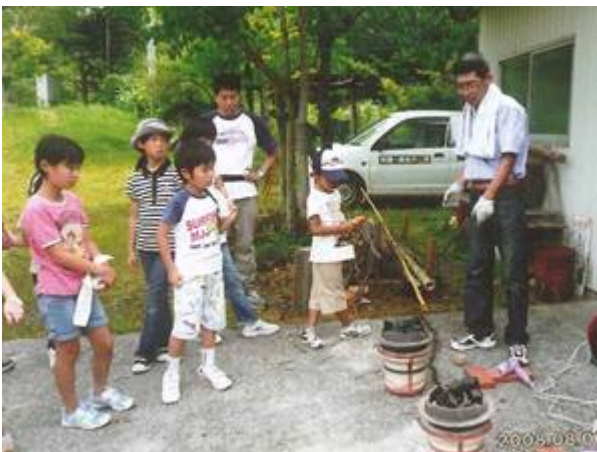
木炭を使っの陶芸（七輪で焼き物制作中）