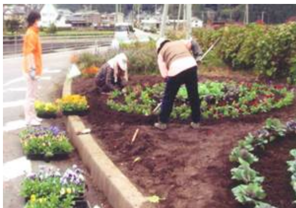
上：ひとつずつ丁寧に植えていきました

今回は、緑の募金の支援を受け、肥料やポット苗等を購入し、地区の方々に協力をしてもらい、会員等含め 15名で、吉野地区の一斉清掃や道路に面する山際の雑木除去作業、草引き作業及び地区内の道路沿いの花壇への植栽を春と秋に行った。