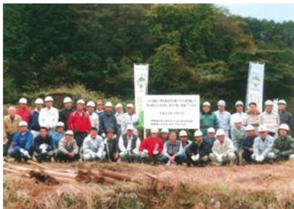
看板を設置し、参加者全員で記念撮影