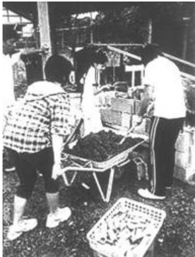
小学校でドラム缶窯で竹炭を焼く指導も行う

植生や孟宗竹の生育調査などの現況調査、孟宗竹の間伐を適宜行った。4月13日には、地域の人々や小学生などが参加する竹の子掘りのイベント「たけのこ掘りた〜い」を開催し、竹の子を掘った後にはスイセンの球根やコスモスや紅花の種巻きも行った。また、竹を主体とした遊具作り、竹炭窯の製作と炭焼きの指導を各4〜5回行った。他にも竹の徐伐作業、竹類の調査、遊歩道の刈払い作業及び道標の整備等を実施したほか、他の団体等との情報交換や、普及宣伝活動も行った。