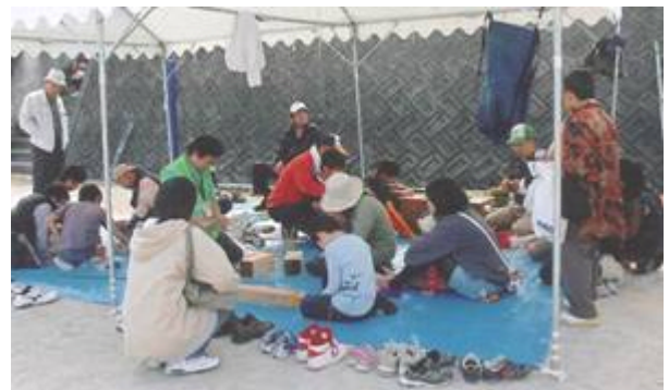
竹工作コーナーは大盛況

竹活用をキーワードに里山の環境保全を考える第7回秦里山まつりを開催し、7つのコーナーを設け、参加者800人が自然に親しんだ。各コーナーでは、竹炭づくりの実演、竹とんぼを作った竹とんぼ飛ばし大会、会場には竹ブランコの設置等竹づくしの内容で行った。また、鳥の巣箱を作って、その日に公園内の木にとりつける等多彩な体験ができた。