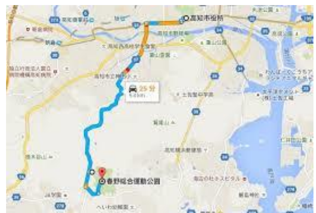
高知県立春野総合運動公園 Map (高知市春野町芳原2485)