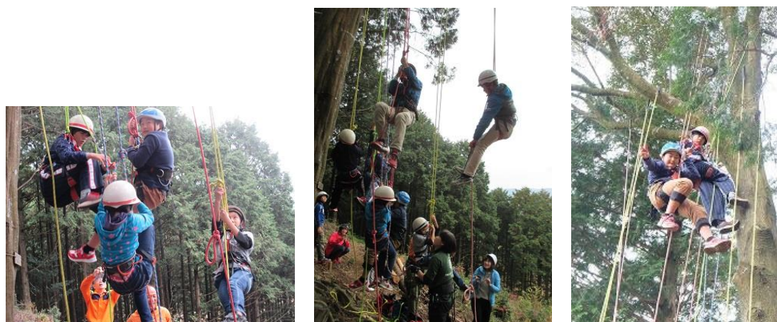
初めてのツリークライミング

ツリークライミングを体験し、木の高さや木の周りを調べる学習もしました。算数の勉強が役に立ち、木の高さ等を図るときに実際に計算する方法を使いました。木の上に登ると遠くの方まで見えて、山の様子が良く分かりました。木の匂いがして山に溶け込んだような気持ちになりました。