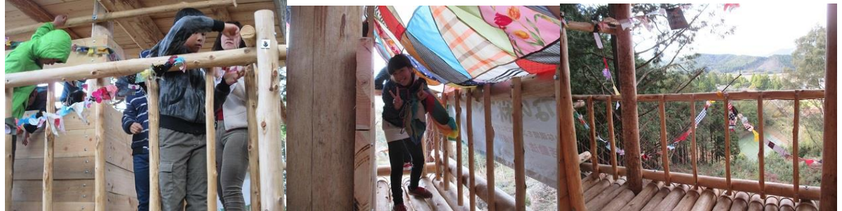
ツリーハウスにフラッグを飾ったらなんだかとっても素敵になりました 世界に一つだけのツリーハウスだよ