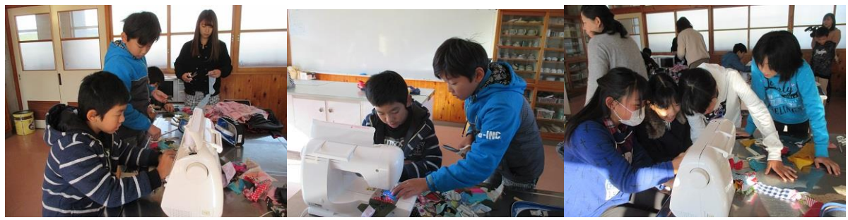
家庭科で習ったミシンを生かし、使わなくなった傘を活用してフラッグづくりをしたよ 上手に縫えたよ