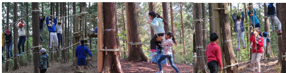
遊具で遊んで学校林を満喫する子どもたち

総合的な学習の時間やそのほかの時間を活用して、学校林に行き、森林の学習をする一貫として楽しんでおり、子どもたちの大好きな場所でもあります。写真は、学校林の遊具で楽しんでいる子どもたちです。