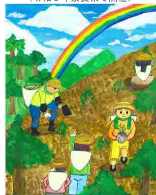
第77回全国植樹祭 ポスター原画作品 (令和9年奈良県で開催)