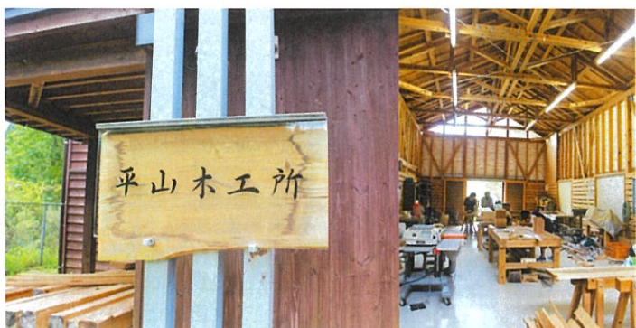
平山木工所(ほとと平山の敷地内) 今年7月に本格的に活動開始。毎週日曜日に、講師指導の元誰でも自由にまな板から机・椅子まで制作出来る場所として提供されています。