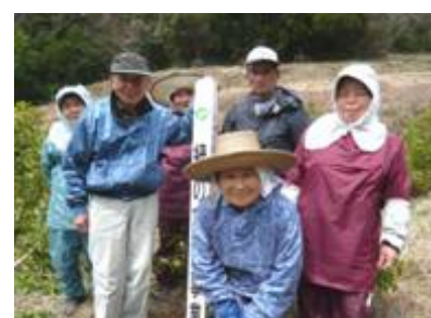
梶原町井の谷地区の桜の里づくり