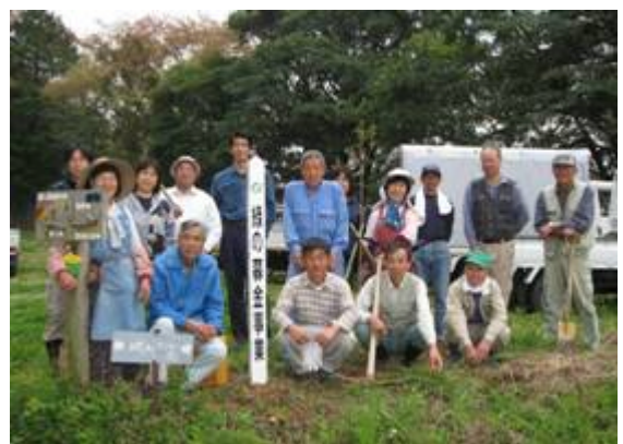
高知市行川地区 (桜々森へ桜20本)