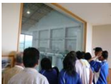
安芸広域ミイトセンターでの見学。