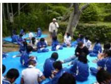
内原野公園でマイ箸をつくりました。