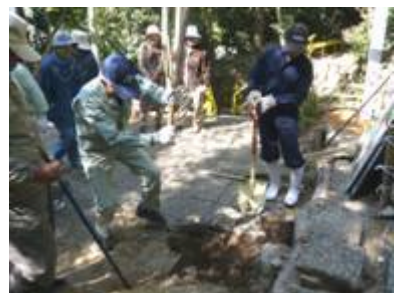
高知市長浜の丸池防災会 (桜10本)

共通するのは、人の集う地域づくりの思いとみなさんの笑顔。どちらの場所でも丁寧に植えてくれました。花が咲くのが楽しみです。