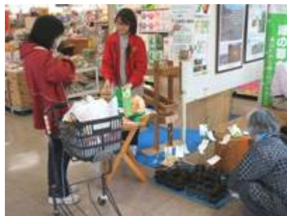
緑を増やそう！ヒマヤ桜の無料配布。