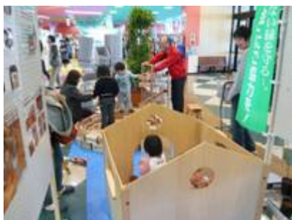
木のおもちゃは子ども達に大人気。