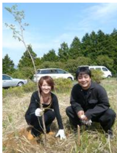
ご夫婦で経営。社員4名で植樹しました。

今後、この活動の輪を同業者やいろんな職種も巻き込んで、広げていきたいとのことです。