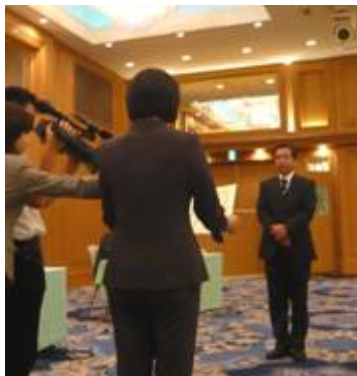
今年も国土緑化推進機構理事長賞を贈呈した(株)サニーマート様

また、(株)サニーマート様から、2,163,839円の「緑の募金」の「寄附目録」を今年度もいただきました。