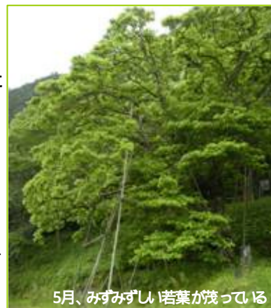
5月、みずみずしい若葉が残っている