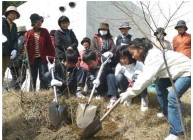
博物館の脇には、参加者を代表して子ども達がセンダイヤザクラを植えました