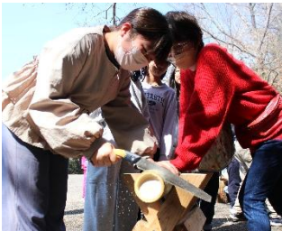
ノコギリを使って竹を切りました。

森林保全ボランティア団体の講師が竹の特徴や竹の切り方などについて説明し、子どもたちはお米を入れた竹筒を火にかけて炊き上がる間に竹工作やピザ焼きを体験しました。ノコギリやオノを使って竹を切り、割る体験をした後、竹のお箸とお皿づくりにも挑戦し、仕上げたお箸を使ってご飯を味わいました。