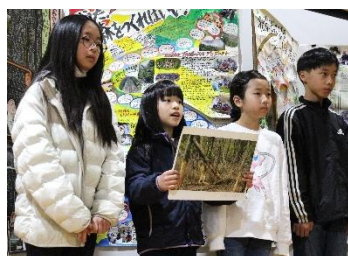
香美市こどもエコクラブ 緑の少年団