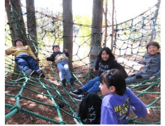
アスレチックネットで自然を体感しました。

今回の大会は初めての試みでしたが、世代を超えた交流など多くの方々のご協力により、とても内容が濃く、次世代を担う子どもたちにとっては貴重な体験の機会となりました。