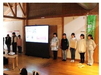
東又小学校緑の少年団