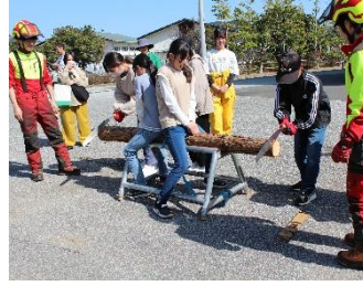
ノコギリを使った丸太切りを体験しました。

割りを体験しました。子どもたちは、初めは不慣れな作業も次第にコツをつかんで、切り終えたときには達成感に満ちた笑顔が広がっていました。