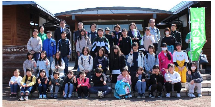
集合写真) 高知県緑の少年団の子もたち

県民共通の財産である森林を未来に引き継ぐために、緑の少年団の育成、活性化につながる大会を次年も同じ時期に実施します。