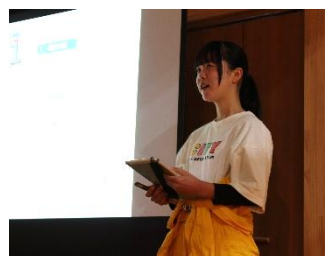
南国市子ども会連合会 緑の少年団