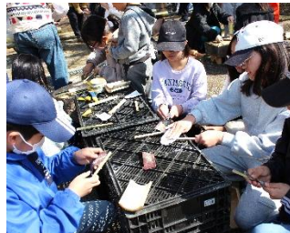
お箸のサイズに竹を割って、ナイフで削りました。